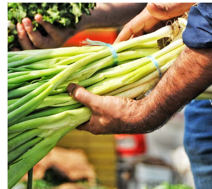
Prodotti che valorizzano la materia prima del territorio

Le domande che contengono l'acquisto di prodotti Dop e Igp e prodotti ad alto rischio spreco sono considerate prioritarie nell'assegnazione delle risorse