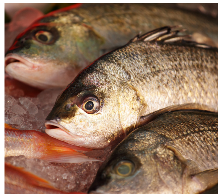
Pesca e acquacoltura