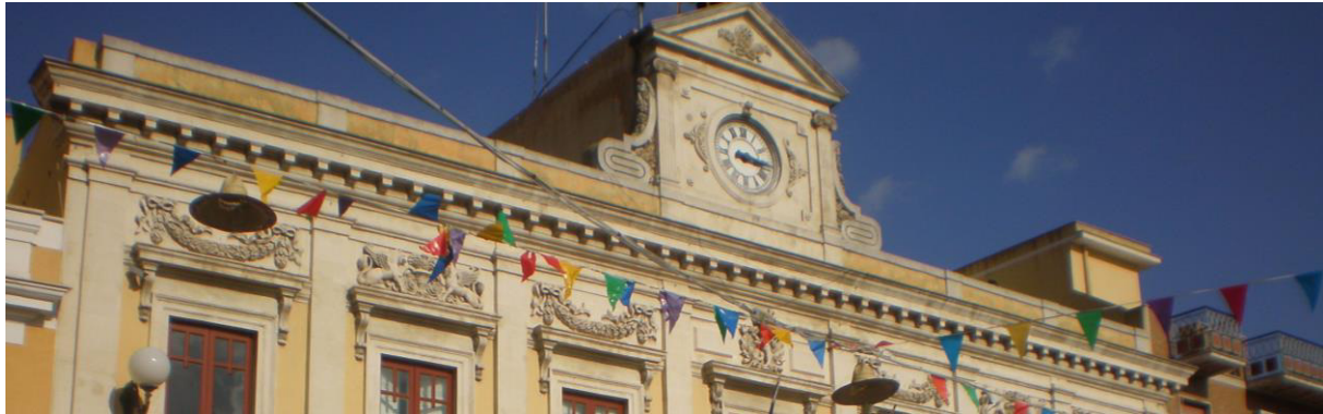
Palazzo della municipalità - Sede storica

(Aggiornamento alla luce della Delibera ANAC n. 1064 del 13 novembre 2019)