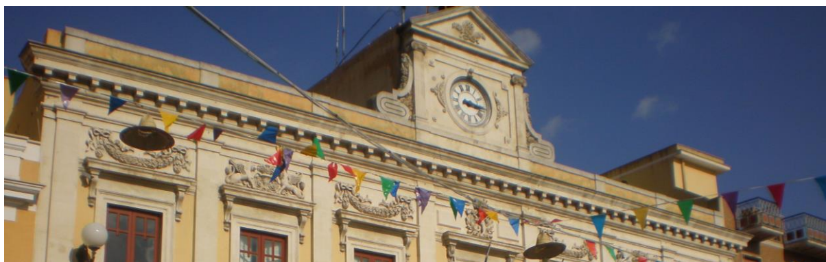
Palazzo della municipalità - Sede storica

(Aggiornamento alla luce della determinazione ANAC n. 12/2015)