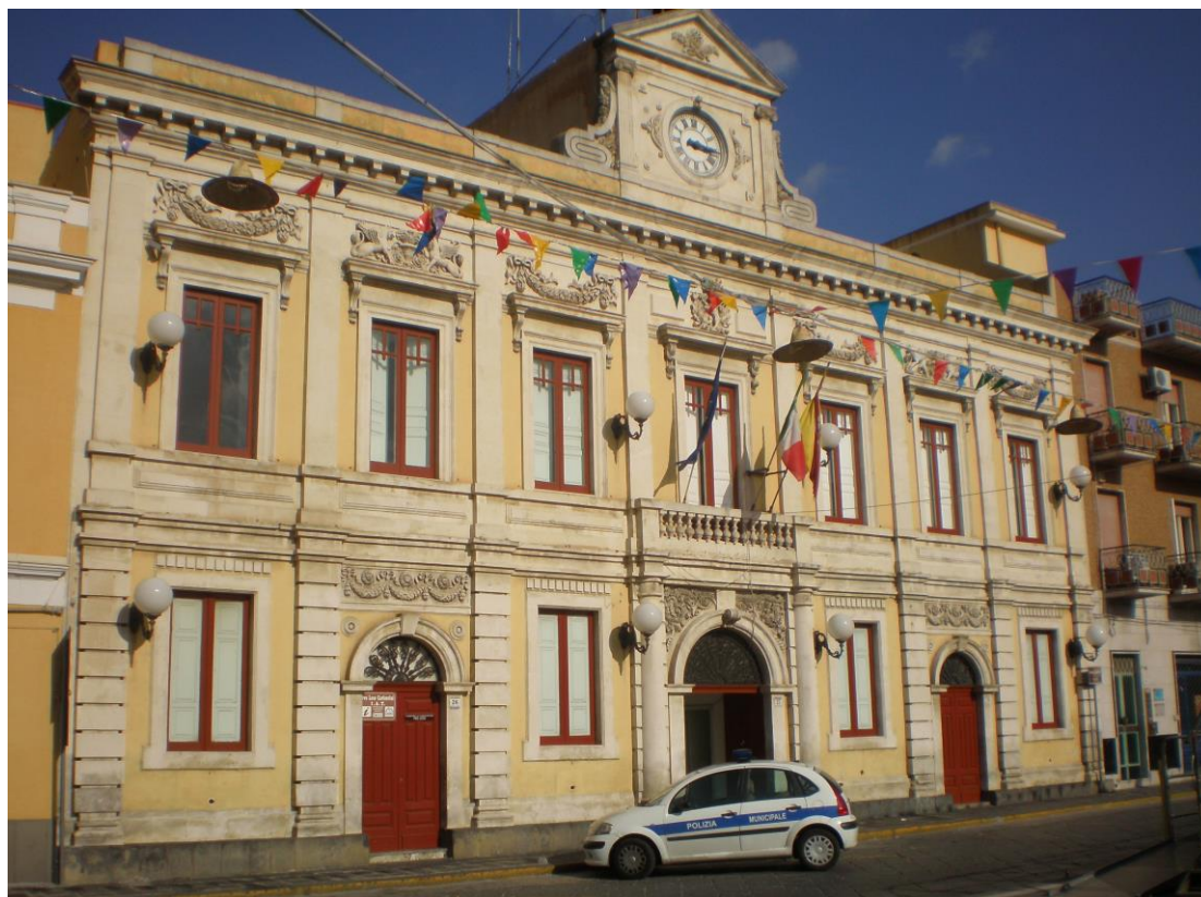
Palazzo della municipalità - Sede storica

(Aggiornamento alla luce della determinazione ANAC n. 12/2015)